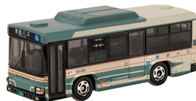
西武バス株式会社 様