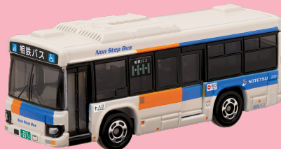
相鉄バス株式会社様