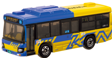
近鉄バス株式会社 様