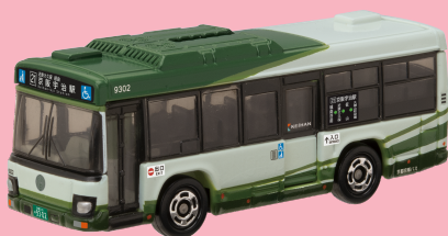
京都京阪バス株式会社様