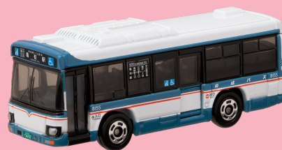
京成バス株式会社様