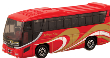
岐阜乗合自動車株式会社 様